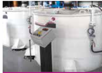
FC1300HC 1,300 - 1,850 rpm